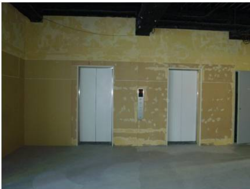
客室エレベーター前